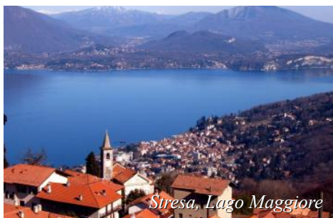
Stresa, Lago Maggiore

Nürnberg, Ulm og til Østerrike. Middag og overnatting på Hotel Vienna Hause Martinpark Dornbirn litt sør for Bregenz.