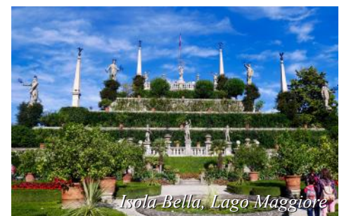
Isola Bella, Lago Maggiore